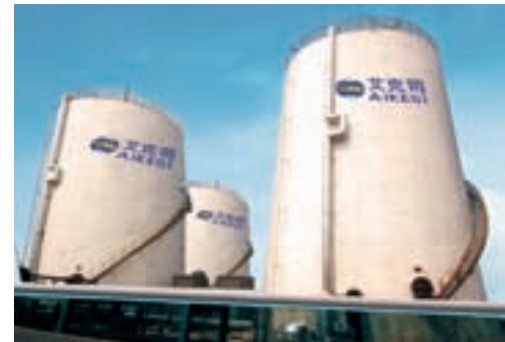
可现场制作 1000 立方 -10000 立方大型储罐