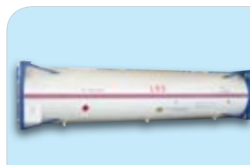
罐式低温集装箱 Tank low temperature container