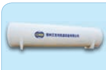
卧式低温储罐 Horizontal low temperature storage tank