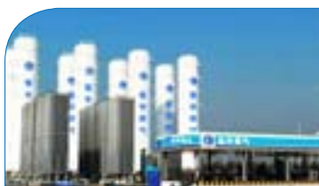
标准式固定加气站 Normal fixed gas station

EXtreme company persists in leading with its unique, high economic performance, complete function, low loss, convenient operation and other merits. So EXtreme is customers' ideal choice.