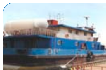
船用加气站 Marine gas station